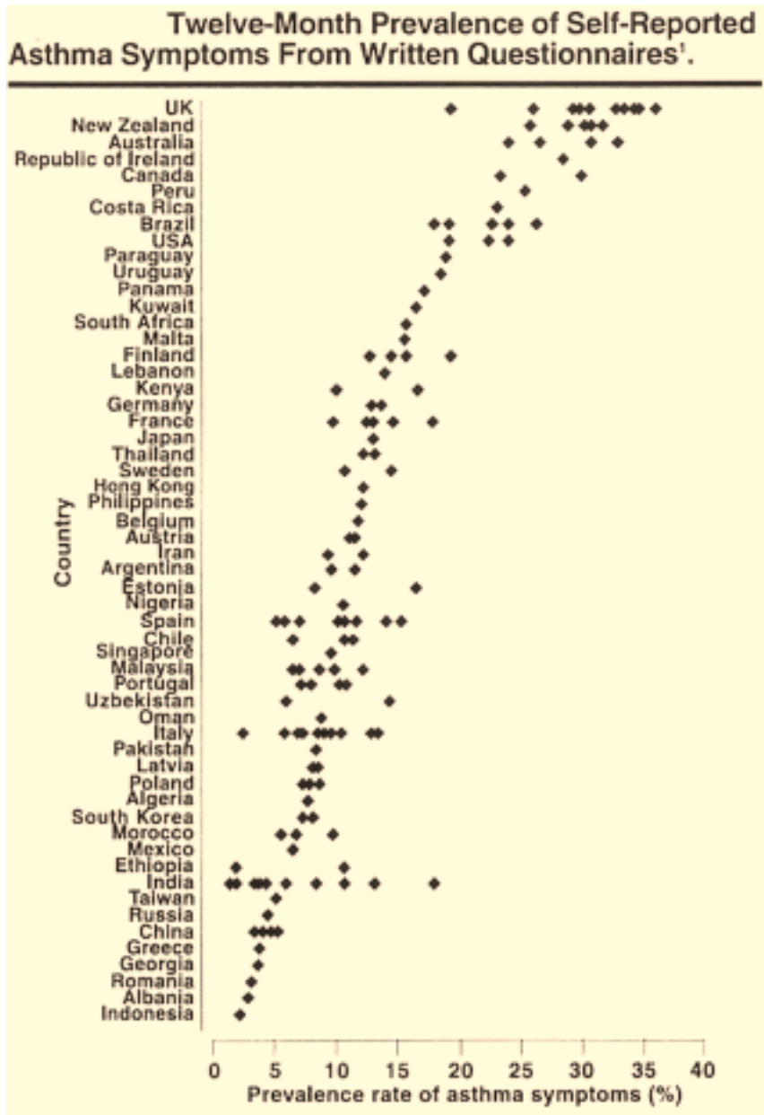
ภาพที่ 1 แสดงอุบัติการณ์ของโรคหอบหืดจากการสำรวจโดย ISAAC