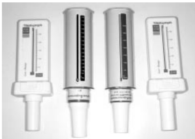
ภาพที่ 2 Peak flow meter แบบต่างๆ

การวัด PEFR ทำได้ง่ายไม่ยุ่งยาก สามารถวัดได้ในเด็กอายุตั้งแต่ 5 ปีขึ้นไป 1, 2, 3 โดยเฉพาะเด็กที่ร่วมมือดีในการเป่า วิธีเป่าทำโดยให้เด็กยืนหรือนั่งตัวตรง ศีรษะตั้งตรง ไม่ต้องปิดจมูกด้วย nose clip ให้เด็กสูดหายใจเข้าให้เต็มที่ แล้วเป่าลมแรงๆ เข้าไปใน peak flow meter โดยใช้ริมฝีปาก seal รอบ mouth piece ให้สนิท เป่าแบบกระแทกให้แรงที่สุดเท่าที่จะทำได้ เป่าสั้นๆ ก็พอ ไม่จำเป็นต้องเป่ายาวจนหมดลมหายใจเหมือน spirometry ลูกศรบนหน้าปัทม์ของ peak flow meter จะถูกแรงลมกระแทก ผลักให้เคลื่อนตัวไปข้างหน้า ยิ่งเป่าแรง ค่าที่วัดได้จะยิ่งสูงขึ้น ควรให้เด็กเป่าอย่างน้อย