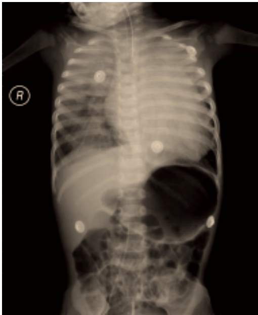
ภาพที่ 2 ภาพรังสีทรวงอกของผู้ป่วยโรคหัวใจพิการแต่กำเนิด (VSD) ซึ่งใหญ่มากและมีภาวะหัวใจวาย (pulmonary edema) กับปอดบวมต้องใช้เครื่องช่วยหายใจ

โดยมากจะพบเงาหัวใจโต ร่วมกับมี pulmonary congestion หรือ edema ภาวะ pleural effusion พบน้อย ในผู้ป่วยโรคหัวใจพิการแต่กำเนิด เช่น Total anomalous pulmonary venous return (TAPVR; sub-diaphragmatic type) เงาของหัวใจอาจไม่โต แต่มี