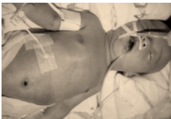
ภาพที่ 1 แสดงผู้ป่วยที่เป็นโรคหัวใจพิการแต่กำเนิดที่เกิดภาวะหัวใจวายจาก big left to right shunt มีอาการหอบ หายใจเร็ว เหงื่อออก ตุนนมเองไม่ได้และน้ำหนักตัวน้อยจากภาวะ pulmonary edema และ respiratory failure ต้องใส่เครื่องช่วยหายใจ

1. มีอาการและอาการแสดงของการทำงานของกล้ามเนื้อหัวใจลดลง หรือผิดปกติ (signs of impaired