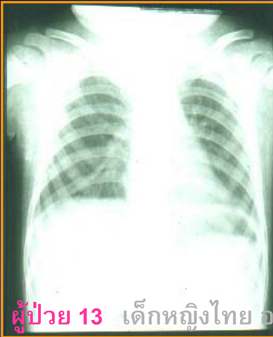
ผู้ป่วย 13 เด็กหญิงไทย อายุ 4 ปี