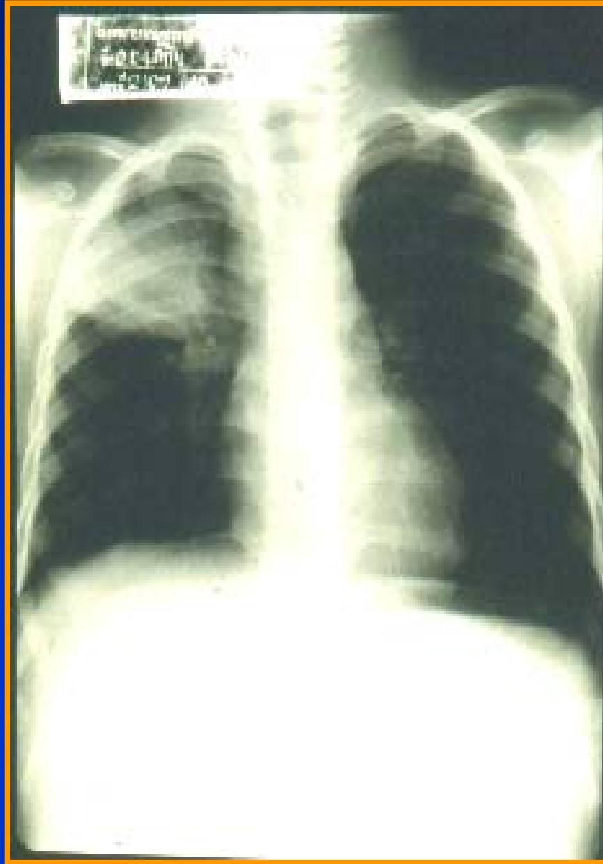
ผู้ป่วย 15 เด็กชายไทยอายุ 5 ปี